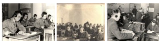
(klikaj, aby powiększyć)