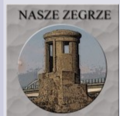
Informacje o Stowarzyszeniu Nasze Zegrze kliknij na logo