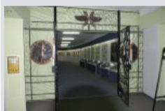
Muzeum Wojsk Łączności w Zegrzu

Serwis internetowy Gminy i Miasta Serock